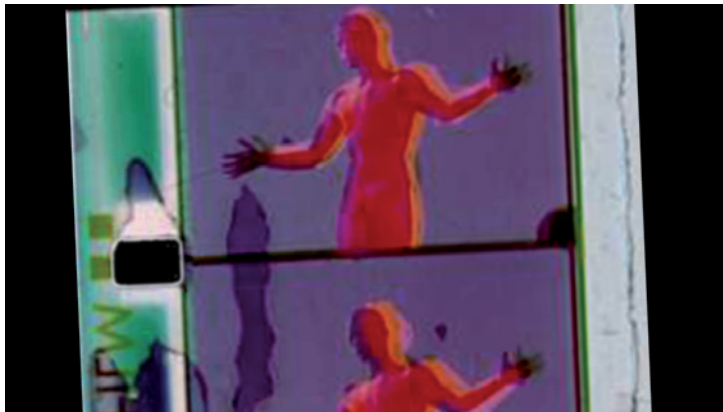
Japon Series de Cécile Fontaine