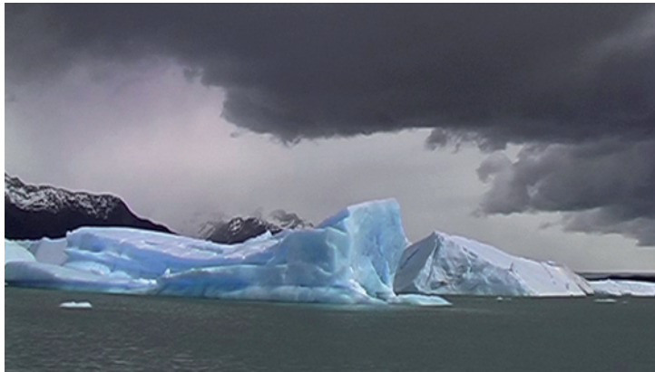
Chemins qui ne mènent nulle part de Danielle Vallet Kleiner