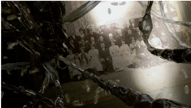
An Aftermath de Patrice Mugnier